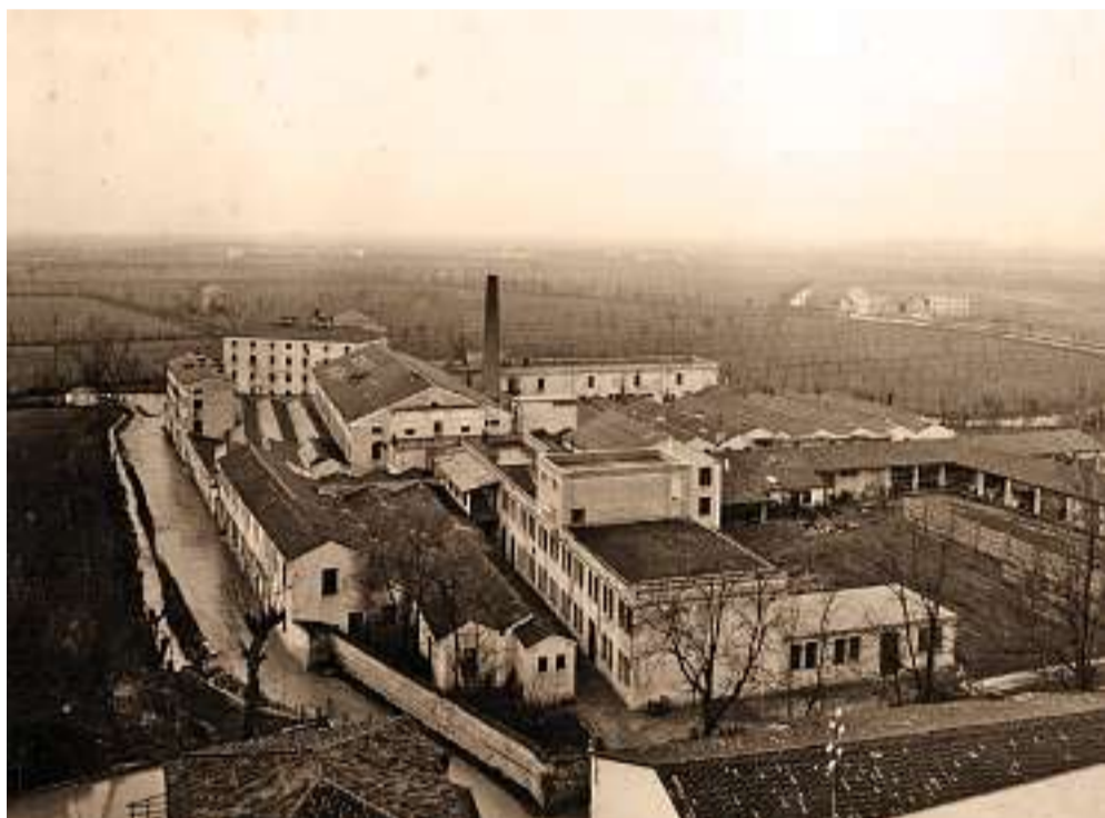
Il canapificio Roi a Cavazzale arrivò ad occupare 1.200 dipendenti nel 1940. Chiuderà nel 1957

Fu aperto uno spaccio per prodotti alimentari scontati ai dipendenti, un sistema di distribuzione di legna giunta dalla valle del Posina; erano or-