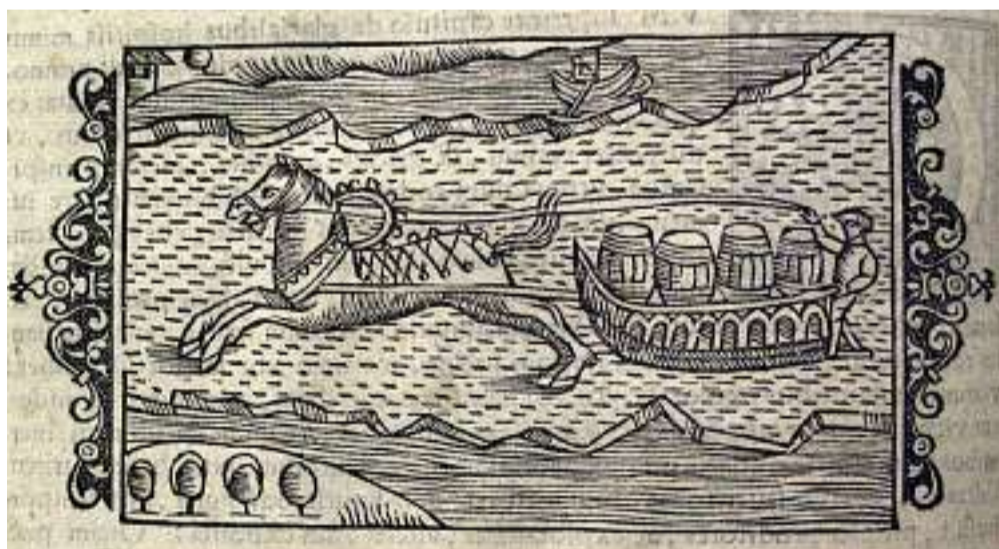
Incisione di una piccola slitta nell'opera di Olao Magno, Historia de gentibus septentrionalibus