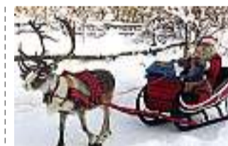
Anche Babbo Natale la usa...

La prima rappresentazione a stampa della slitta arriva a Vicenza nel Cinquecento con l'opera del vescovo di Uppsala Olaf Manson, l'"inventore" del baccalà. Olaf Manson, nome latinizzato in Olao Magno, scrisse l'imponente "Historia de gentibus septentrionalibus" per far conoscere le tradizioni dei paesi del Nord. L'opera, pubblicata a Roma nel 1555, è arricchita da preziose incisioni di animali nordici, di vegetazione tipica, di città e cavalieri, ma anche di slitte e di sci. Lesse e rilesse quest'opera il prete ravennate Francesco Negri - vissuto tra il 1623 e il 1698 - che ne rimase talmente affascinato da voler constatare di persona se quanto raccontato da Olao era proprio vero. Affetto dal "mal del nord", Negri racconta nel suo libro "Viaggio settentrionale" stampato a Padova nel 1700 il suo viaggio intrapreso nel 1663 a bordo di una slitta che lo