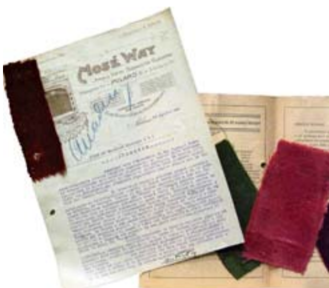
Le stoffe e il preventivo per il nuovo sipario, anni '20