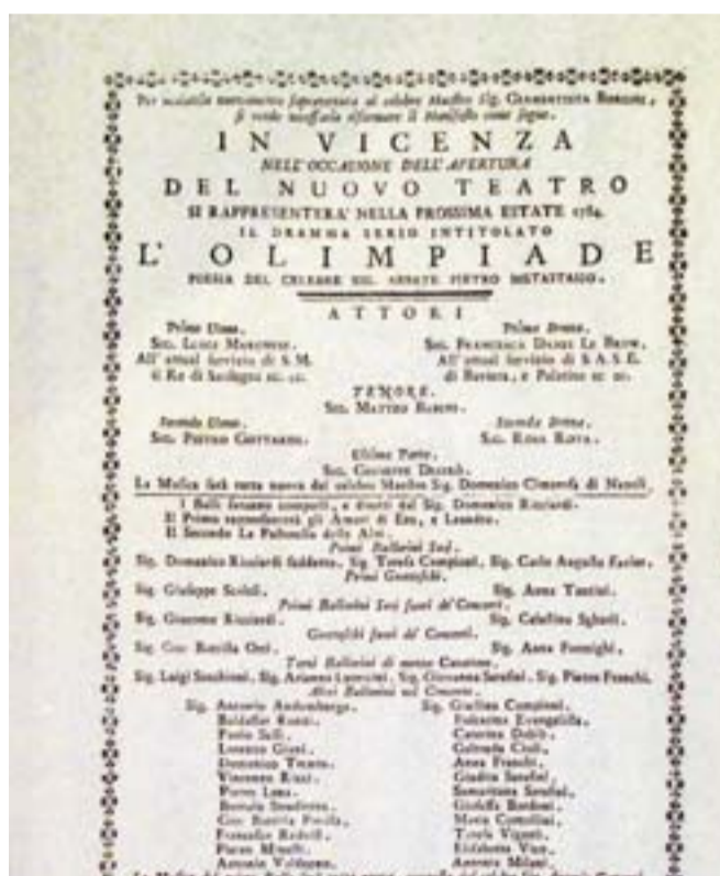
Avviso teatrale dell'Olimpiade di Domenico Cimarosa, prima opera