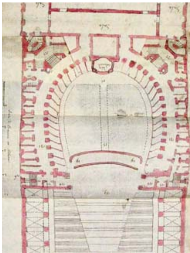
Un disegno acquerellato (BcB, Archivio del Teatro Eretenio, TE.2)