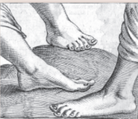
Diversi tipi di piede dalla Fisionomia dell'huomo del Della Porta (Biblioteca civica Bertoliana)