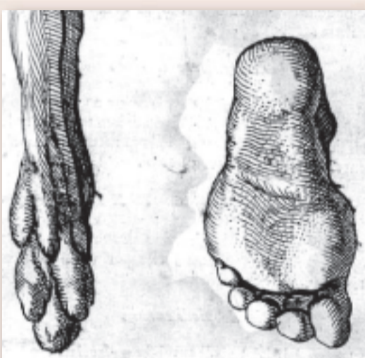
Il piede piatto dell'uomo raffrontato alla zampa della volpe

Chiara Giacomello scrivi@bibliotecabertoliana.it